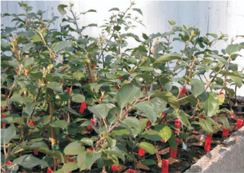
Enten van wilde appel, vermeerderd ter bewaring en bescherming van deze uiterst zeldzame boomsoort.

Voor sommige soorten zijn de autochtone individuen zo zeldzaam dat een vegetatieve vermeerdering van de resterende individuen zich opdringt. Via aanplantingen met deze stekken of enten kunnen we zo op zijn minst de genetische diversiteit van deze relictten bewaren (= genenbank). Het INBO legt genenbanken aan van onder andere zwarte populier, wilde appel, verschillende wilde rozen, wegedoorn en fladderiep.