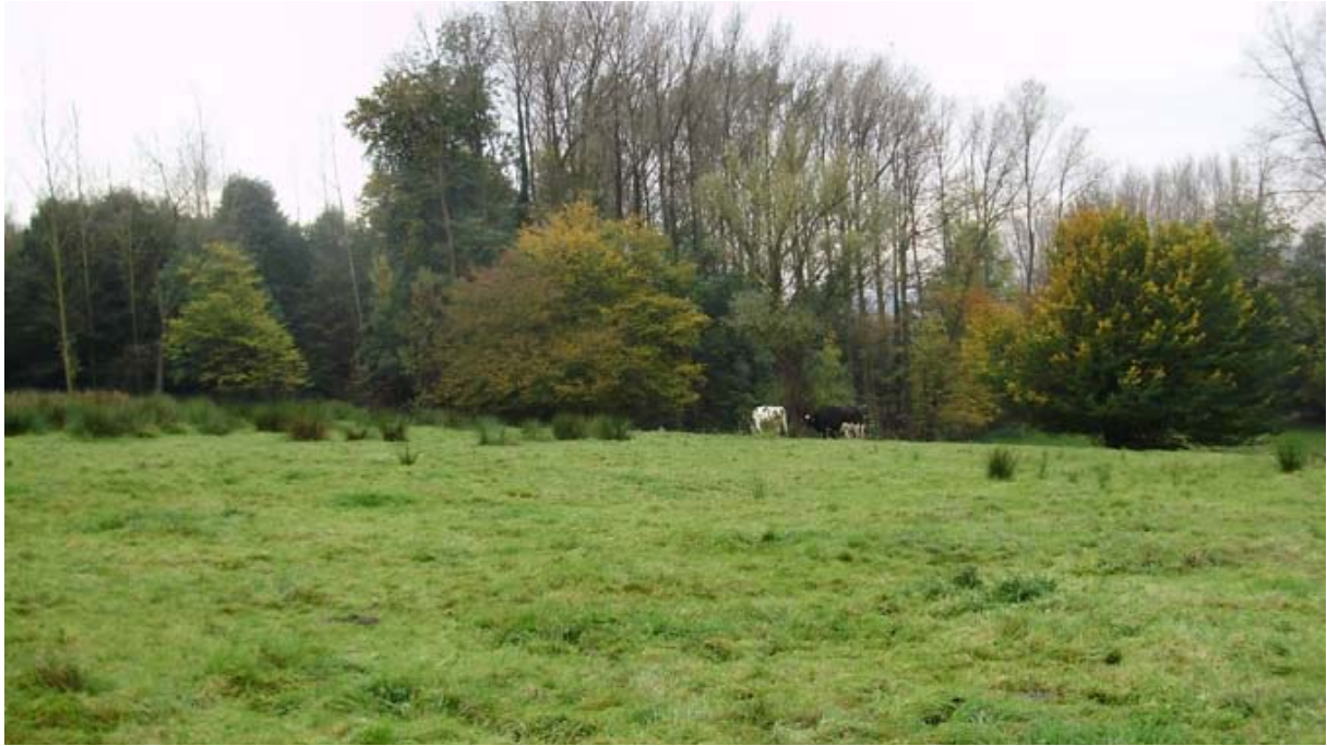
Zicht op de locatie